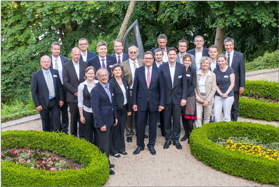
Titelbild: Würth Haus Berlin, Repräsentanz der Würth-Gruppe; Adolf Würth GmbH & Co. KG